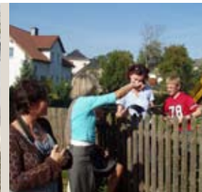
Les villageois aux commandes de la gestion sociale et quotidienne du village