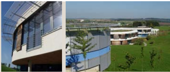
Les établissements d'Europe-BBW-Leiter

La réunion du groupe en matinée se clôturait par un déjeuner rapide dans les établissements d'Euro-BBW-Leiter à Bitburg, institution vouée à la formation des jeunes inadaptés à la société (handicapés physiques et mentaux, jeunes en retard scolaire) proposant notamment des formations dans le secteur de l'Horeca, en infographie... En marge de l'aménagement des villages, cette halte fut l'occasion de découvrir un projet d'architecture contemporaine de qualité.