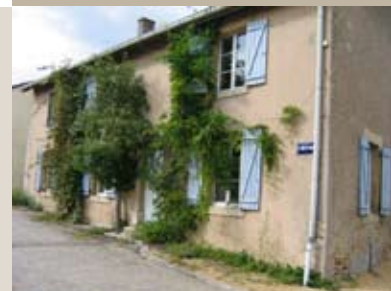
Le village bucolique de Ville-sur-Yron et ses bornes de «lecture»