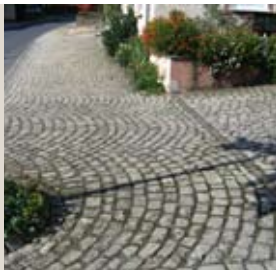
Des aménagements sensibles qui valorisent le village