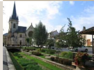
Aménagement d'accès au ruisseau, passerelles reliant les berges, cabine électrique habilement habillée de bois ...