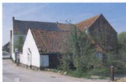
3 - Hesbaye