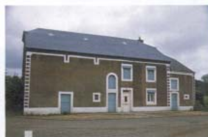
8 - Lorraine

Ces quelques images, bien que loin d'être exhaustives, témoignent déjà à suffisance de la diversité de l'habitat rural en Wallonie. Volumes et matériaux typiques forgent ainsi l'identité architecturale de chaque région.