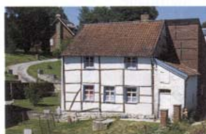
6 - Fagne-Famenne