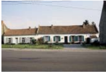
Stamburges (Plateau limoneux hennuyer)

« A chaque région, sa maison » ! Impossible bien sûr de confondre, par exemple, une maison du Plateau limoneux hennuyer, aux murs de briques blanchies à la chaux, au volume étroit et allongé couvert d'une toiture de tuiles rouges, avec une maison ardennaise, au volume profond, avec ses murs de pierre et son large toit d'ardoises.