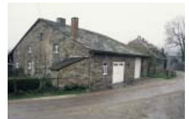
Odeigne - maison-bloc étalée