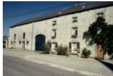
Une ferme du 19 e en Famenne

Enfin et surtout, il faut encore distinguer, dans chaque région, des sous-ensembles architecturaux influencés par des contextes sous-régionaux différents, mais également par la tradition architecturale de la région voisine. Ainsi, dans le Plateau brabançon, les maisons du 'Pays de Soignies' ont-elles un air de famille avec les maisons du Plateau hennuyer, alors que leurs consœurs du 'Pays de Nivelles' prennent un air résolument hesbignon.