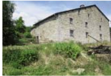
La Comté (Ardenne)

Mais à y regarder de plus près, des nuances s'imposent : tout d'abord, aux 18 e et 19 e siècles, la maison d'un artisan ou d'un saisonnier n'a pas l'ampleur de la ferme du laboureur.