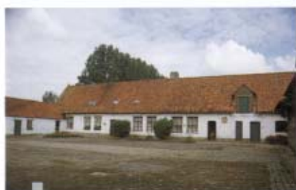
1 - Plateau limoneux hennuyer