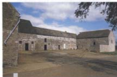
5 - Condroz