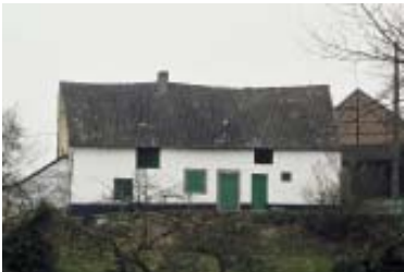
Une ferme du 18 e en Famenne

Ensuite, techniques et besoins ont peu à peu évolué et la ferme famennaise du 19 e siècle est, par exemple, plus profonde et plus longue que son aînée du 18 e siècle, et a abandonné le colombage et le torchis au profit de matériaux plus durables.