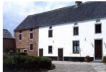
Maison du Pays de Nivelles

Loin de remettre en cause la cohérence de chaque ensemble régional, ces nuances et variantes enrichissent un peu plus notre patrimoine architectural rural.