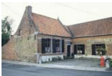
Maison du Pays de Soignies

Enfin et surtout, il faut encore distinguer, dans chaque région, des sous-ensembles architecturaux influencés par des contextes sous-régionaux différents, mais également par la tradition architecturale de la région voisine. Ainsi, dans le Plateau brabançon, les maisons du 'Pays de Soignies' ont-elles un air de famille avec les maisons du Plateau hennuyer, alors que leurs consœurs du 'Pays de Nivelles' prennent un air résolument hesbignon.