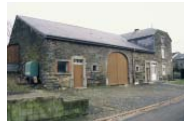
Bertrix - ferme en barre de T