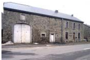
Bertrix - ferme en long