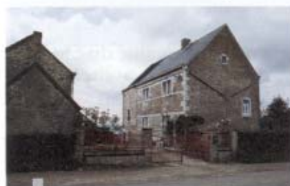
4 - Pays de Herve