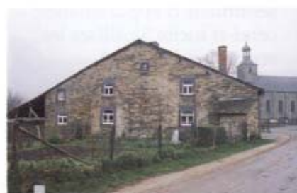
7 - Ardenne