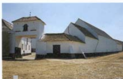
2 - Plateau limoneux brabançon