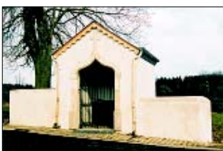
Schockville (en cours de travaux)

A Schockville (Attert), la chapelle Jeanty est en cours de restauration. Ce petit édifice néogothique construit à la fin du XIXème siècle, se singularise par son entrée à arc en accolade prolongé par une croix. Après travaux, la chapelle sera mise hors eau par le placement d'une nouvelle toiture et d'une protection contre l'humidité. La remise en état de la grille d'entrée, la pose d'un carrelage et la réalisation d'un nouveau crépi paracheveront le travail de mise en valeur de l'élément.