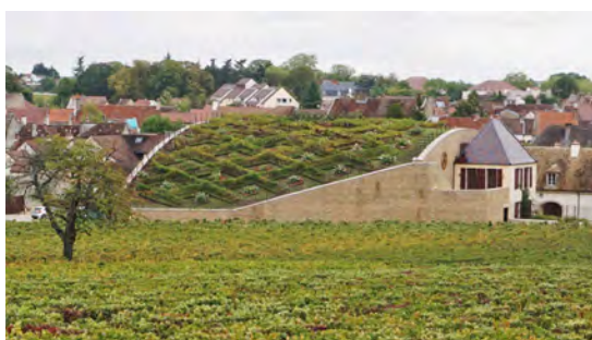
Maison Boisset – arch. F.Didier

L'architecture des chais dans le paysage : discrète ou plus affirmée ?