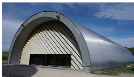
Château La Coste – arch. J.Nouvel