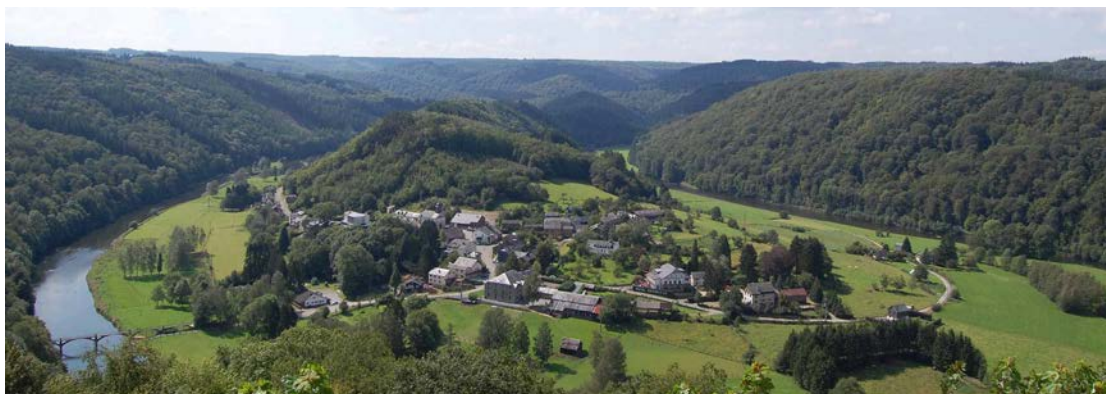
La boucle de Frahan classée comme site

Mais de nombreux autres biens, immeubles ou sites archéologiques sont inscrits dans différents inventaires pour leur intérêt patrimonial (par exemple, environ 50000 immeubles répertoriés à l'Inventaire du patrimoine culturel immobilier (IPIC)). Tout ce patrimoine mérite d'être protégé, notamment par une législation propre : le Code wallon du Patrimoine ou CoPat. Celui-ci entrera en vigueur le 1 er juin 2019. Le décret du 26 avril 2018 et son arrêté d'exécution mettent en place cette importante réforme.