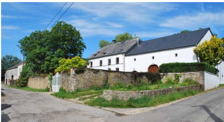
Le village de Guirsch classé comme ensemble architectural