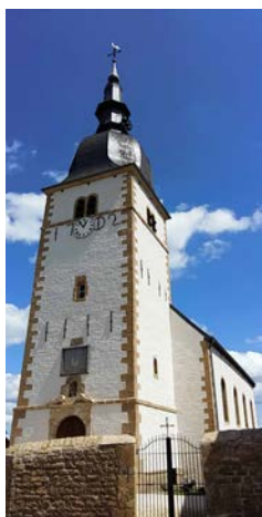
L'église de Chassepierre classée comme monument

En Wallonie, 4139 biens sont classés à ce jour ( pour la province de Luxembourg , ces biens classés sont au nombre de 573 : 367 monuments, 180 sites, 4 ensembles architecturaux et 29 zones de protection).